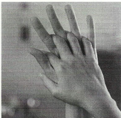
Стадия 3. Ладонь к ладони рук с перекрещенными пальцами