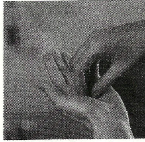
Стадия 6. Кругообразное втирание сомкнутых кончиков пальцев правой руки на левой ладони и наоборот