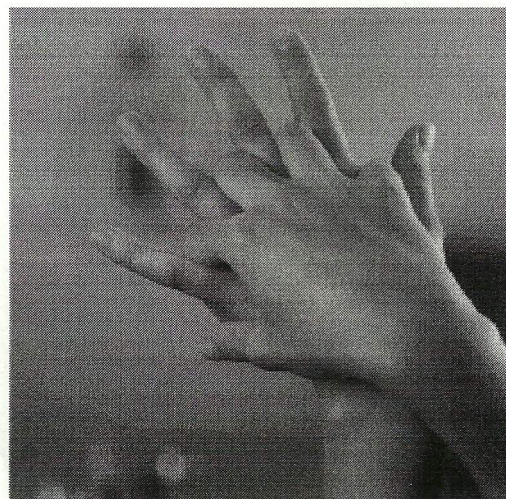
Стадия 2. Правая ладонь на левую тыльную сторону кисти и левую ладонь на правую тыльную сторону кисти.