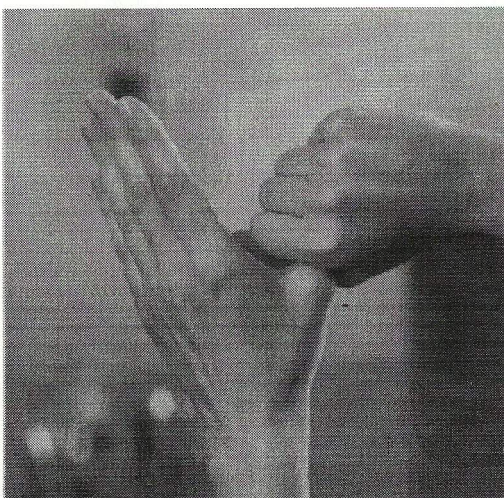
Стадия 5. Кругообразное растирание левого большого пальца в закрытой ладони правой руки и наоборот